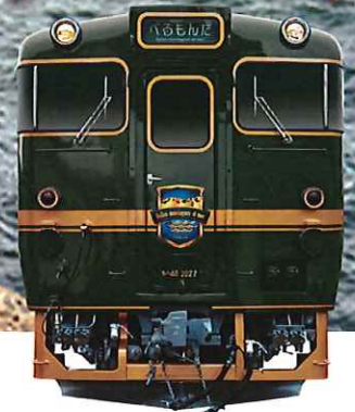
海側・立山連峰側