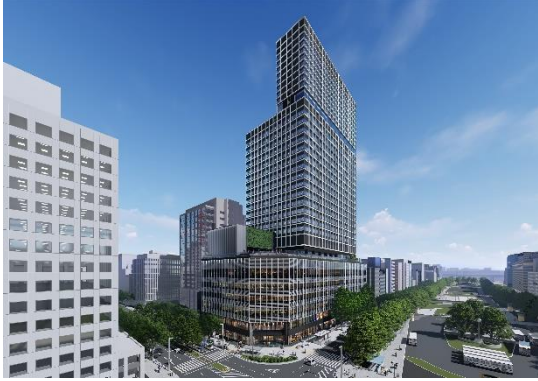
①完成予想図（北西から）