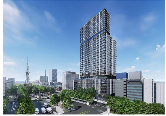
②完成予想図（南西から）