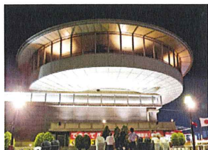
中日ビル屋上にUFO現る??

6月以降も月曜日は「マンデープライス」、火曜日は「レディースデー」で、大人一人3,000円です。ご予約はビアガーデン予約専用 ☎052(263)7607までどうぞ。予約状況はビアガーデンホームページ( http://beergarden.chunichi-palace.co.jp/ )でも確認できます。