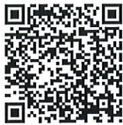
思い出博覧会QRコード